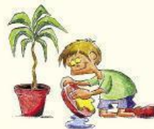
Impidamos que los recipientes en uso acumulen agua