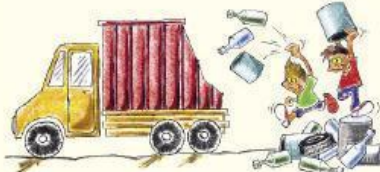
Desechemos todos los objetos inservibles capaces de acumular agua de lluvia.