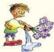
Cambiamos periódicamente el agua de jarrones y floreros

Para prevenir el dengue, impidamos la reproducción del mosquito: evitemos tener en nuestra vivienda recipientes que contengan agua limpia estancada