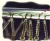
Larvas del mosquito transmisor

Este mosquito sólo se reproduce si dispone de agua limpia estancada, donde se desarrollan sus larvas.