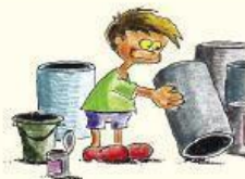
Mantengamos boca abajo los recipientes en desuso