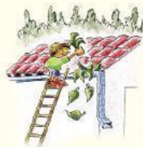
Despejemos las canaletas