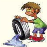
Evitemos la acumulación de agua en el interior de neumáticos