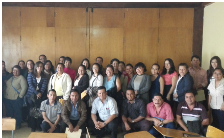
Personal del IGSS Izabal