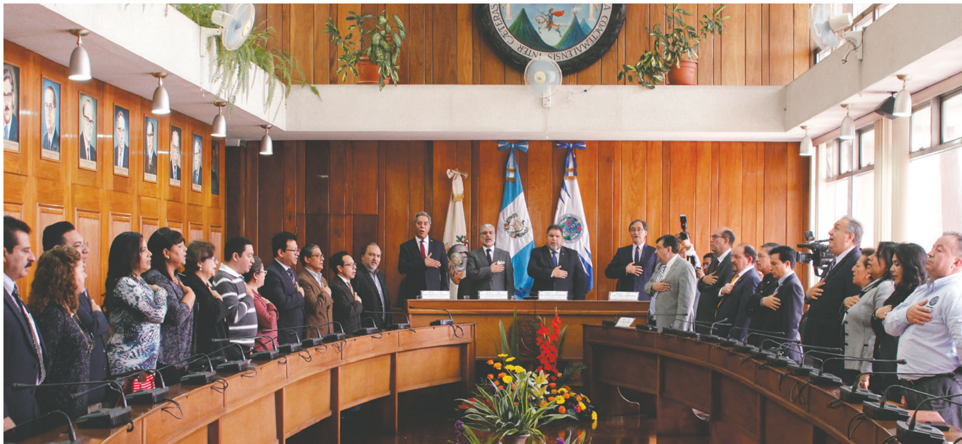
En la actividad participaron decanos y directores de las distintas unidades académicas de la Universidad de San Carlos de Guatemala (Usac).