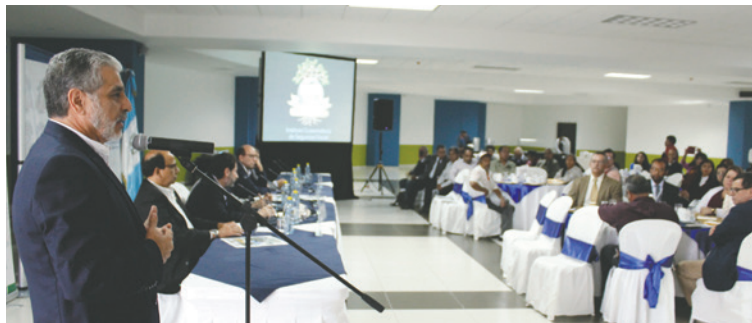
Las autoridades informaron sobre el equipamiento del nuevo hospital y respondieron las preguntas de miembros de la sociedad civil.

Proyectos (UNOPS) y de la sociedad civil.