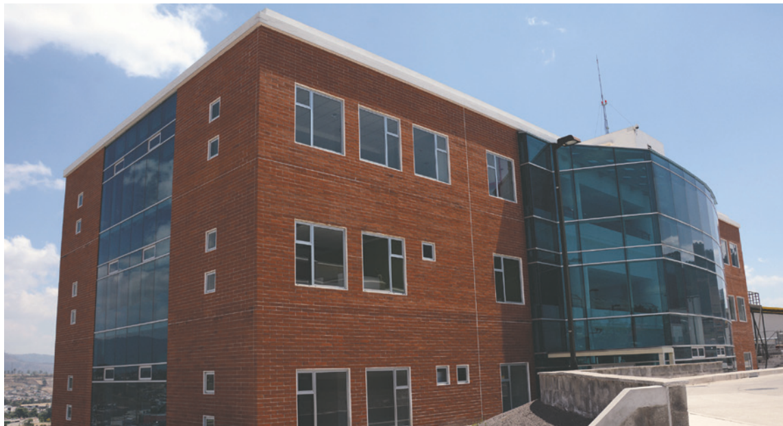
Próximamente será inaugurado este moderno centro hospitalario que atenderá a la región occidental.

Luego se desarrolló en las instalaciones del nuevo Hospital Regional de Occidente una presentación de avances en el proceso de entrega y equipamiento de la unidad médica, a la cual fueron invitados repre-