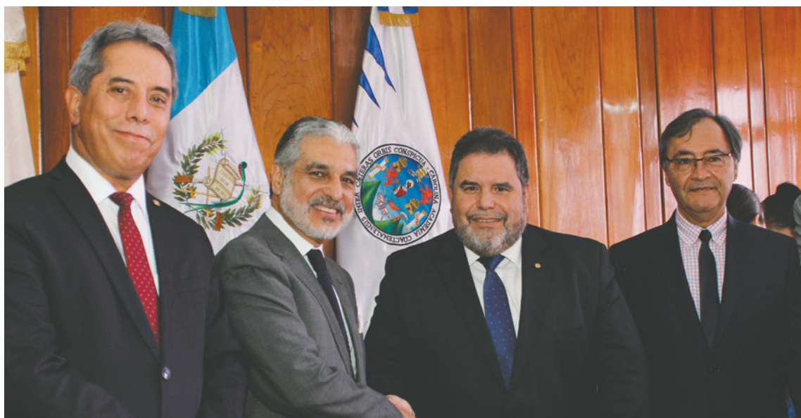
Las autoridades de ambas instituciones expresaron su satisfacción por la suscripción del documento.

“Como muestra de nuestro compromiso y seriedad de este