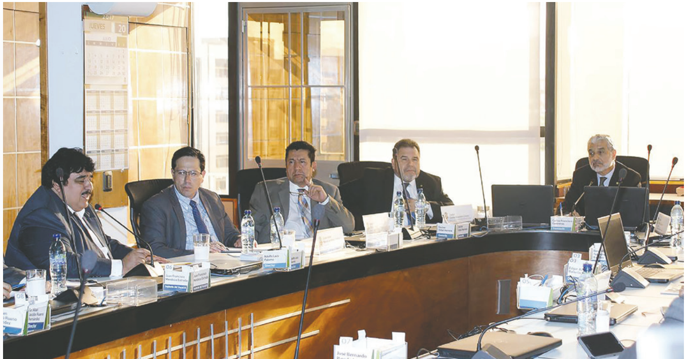
Rectores y representantes de universidades (al centro) destacaron la importancia del fortalecimiento de la Seguridad Social en el país.

Las universidades por su parte supervisarán a los estudiantes que se incorporen a las instalaciones del Instituto por medio de docentes previamente acreditados, según el reglamento; además, el IGSS brindará asesoría para apoyar los procesos de prestación de atención a los afiliados.