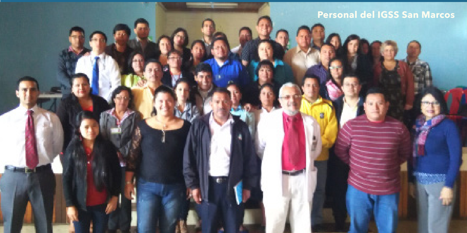
Personal del IGSS San Marcos

En marzo del presente año, el Departamento de Cambio Institucional de la Subgerencia de Integridad y Transparencia Administrativa, con el apoyo del Departamento de Capacitación y Desarrollo, continuó exitosamente la actividad de sensibilización denominada: "Fortaleciendo la Integridad y Transparencia Administrativa del IGSS" en los departamentos de San Marcos y Zacapa.