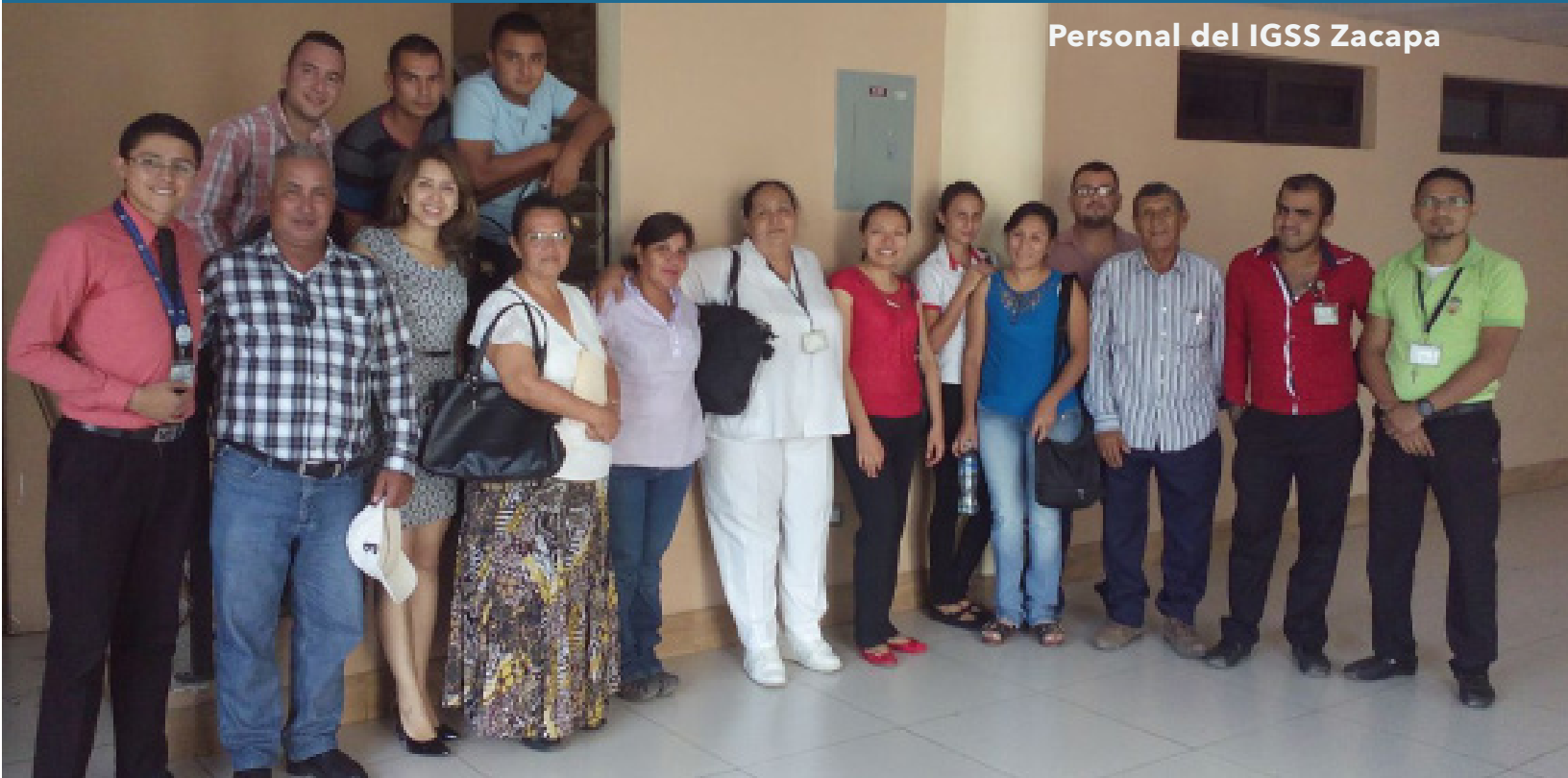
Personal del IGSS Zacapa