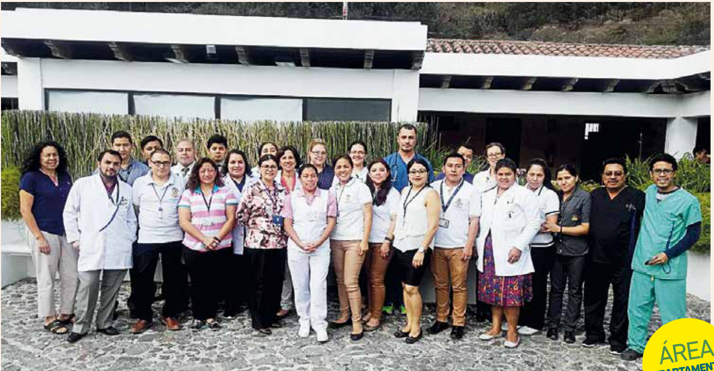
Colaboradores del Consultorio de Antigua Guatemala, 1er. día del taller "Haz tu parte, trabaja con transparencia"