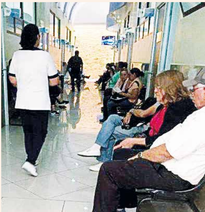
Unidad de Consulta Externa de Especialidades Médico-Quirúrgicas Gerona

El Departamento Cambio Institucional, de la Subgerencia de Integridad y Transparencia Administrativa, realizó monitoreo en las Unidades Médicas, Hospital General Doctor Juan José Arévalo Bermejo y Unidad de Consulta Externa de Especialidades Médico-Quirúrgicas Gerona, dando seguimiento a las sensibilizaciones con el tema de cita escalonada, como resultado se estableció que actualmente la cita escalonada se está implementando con éxito.