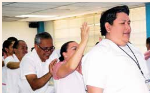
Colaboradores Hospital General de Accidentes Ceibal

En abril del presente año el Departamento de Cambio Institucional, de la Subgerencia de Integridad y Transparencia, realizó con éxito la intervención “Haz tu parte, trabaja con transparencia” en el Hospital General de Accidentes Ceibal.