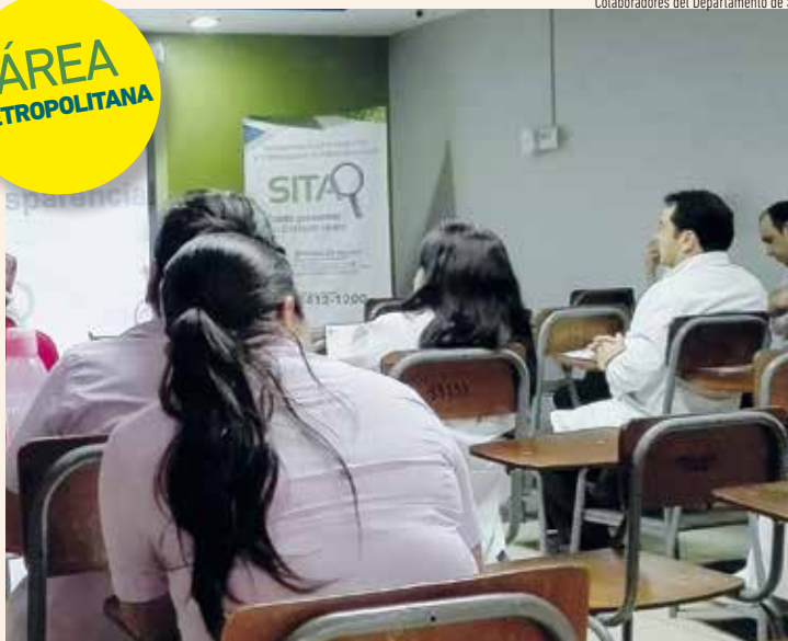
Colaboradores de Policlínica