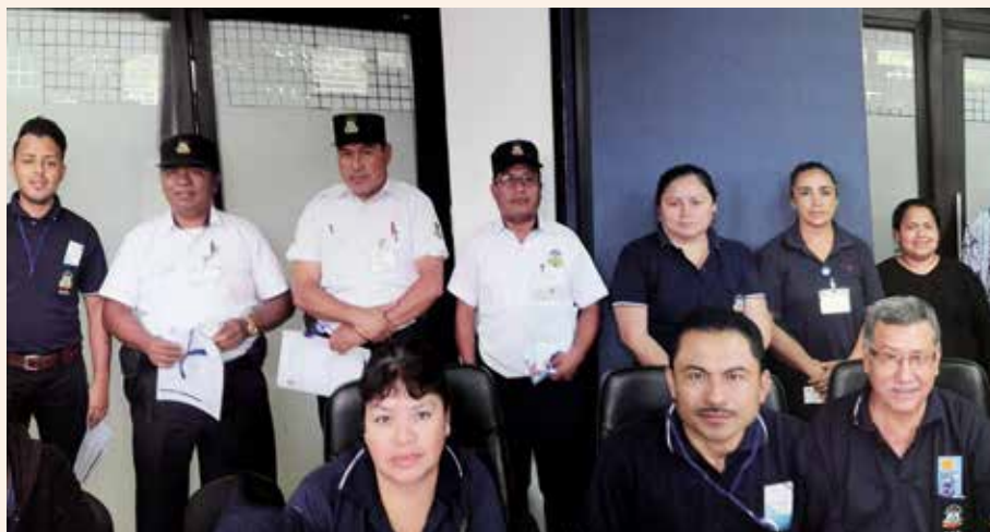
Colaboradores del Departamento de Servicios de Apoyo, Oficinas Centrales

Se realizó con éxito el taller “Haz tu parte, trabaja con transparencia” por el equipo del Departamento de Cambio Institucional de la Subgerencia de Integridad y Transparencia durante el mes de abril del presente año, en Policlínica y Departamento de Servicios de Apoyo, Oficinas Centrales.