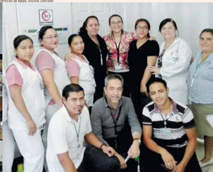
Colaboradores de Policlínica