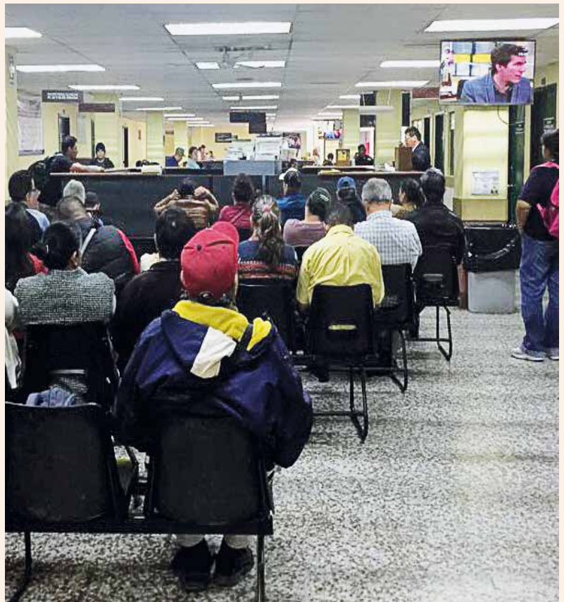
Hospital General Doctor Juan José Arévalo

El objetivo de la cita escalonada es distribuir en orden de tiempo, registro, asistencia y atención de los pacientes.