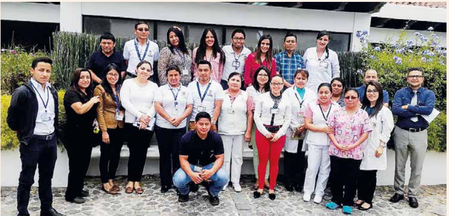
Colaboradores del Consultorio de Antigua Guatemala, 2do. día del taller "Haz tu parte, trabaja con transparencia"

La Subgerencia de Integridad y Transparencia Administrativa a través del Departamento de Cambio Institucional, durante abril del presente año, desarrolló el taller "Haz tu parte, trabaja con transparencia" en el Consultorio de Antigua Guatemala.