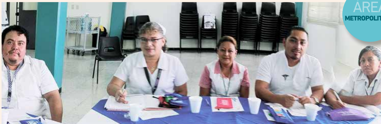
Colaboradores Hospital General de Accidentes Ceibal