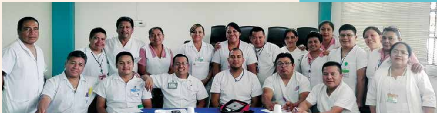
Colaboradores Hospital General de Accidentes Ceibal