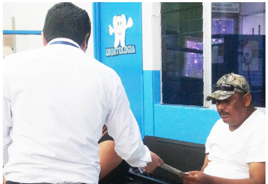
Monitoreos realizados del 01 al 30 de Noviembre 2017

En cumplimiento del objetivo estratégico, Institucional relativo a la satisfacción en el servicio y la dignificación de los trabajadores, y como una contribución importante para el bienestar organizacional, durante noviembre de 2017 se efectuaron los siguientes monitoreos a nivel metropolitano y departamental: