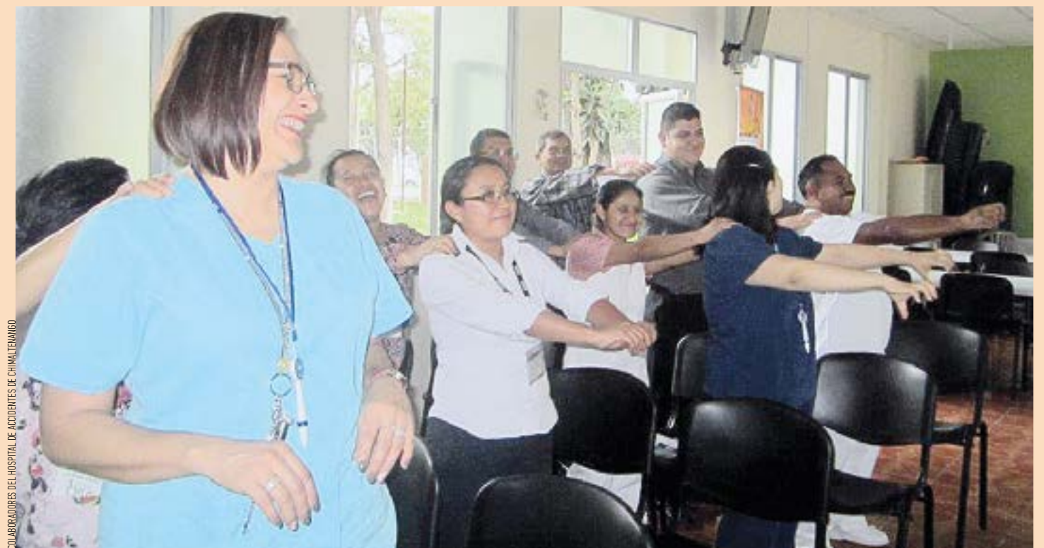
COLABORADORES DEL HOSPITAL DE ACCIDENTES DE CHIMALTENANGO