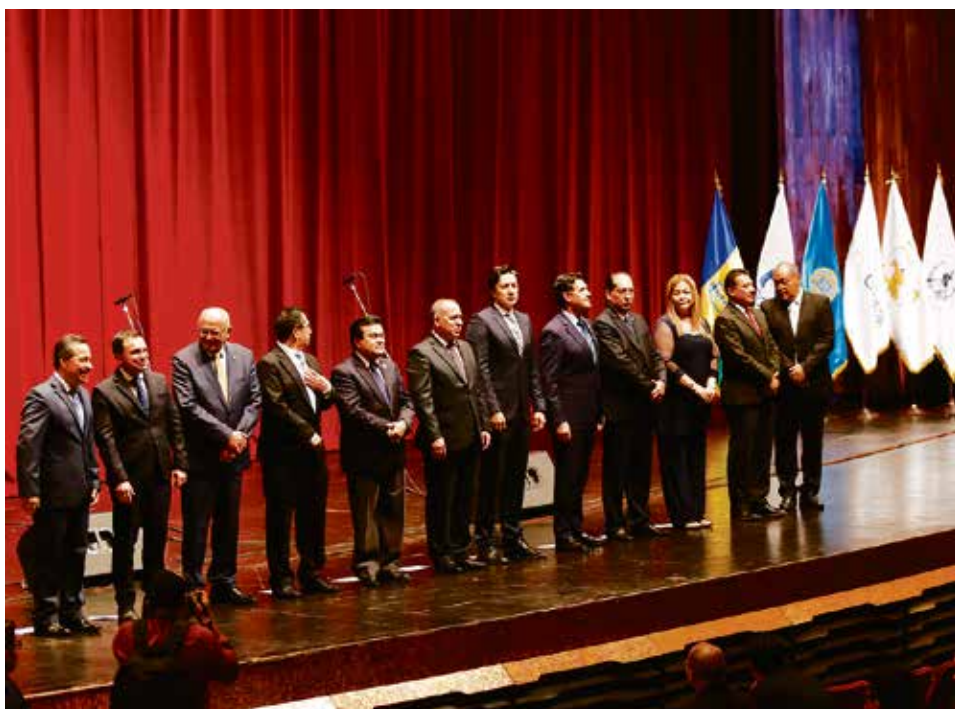
Funcionarios de las 11 instituciones públicas que firmaron la Carta de Entendimiento.