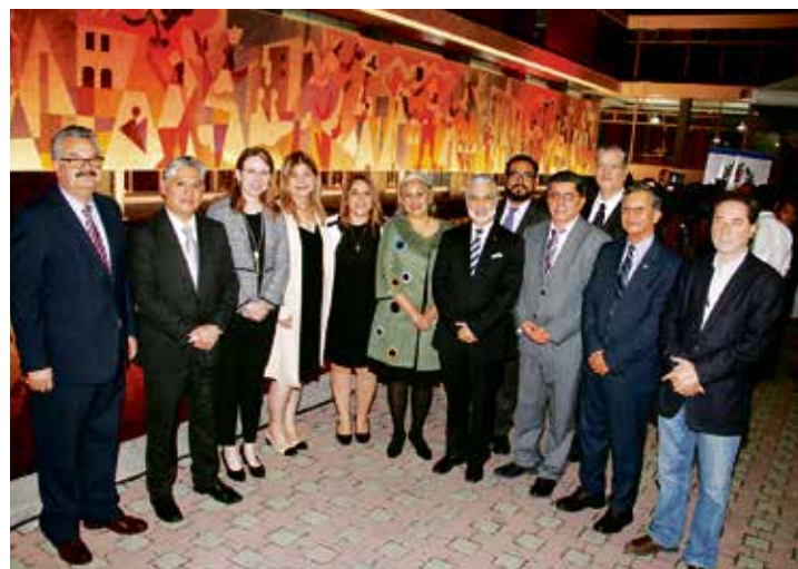
Miembros de la Junta Directiva y autoridades administrativas del Seguro Social participaron durante la entrega del mural restaurado.