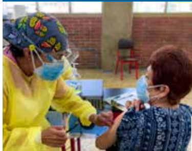
Colaboradores de SITA ayudan para que el proceso de vacunación se lleve a cabo.