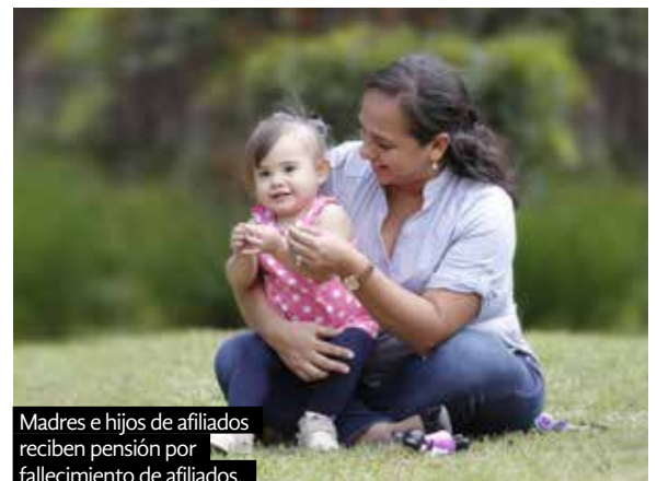
Madres e hijos de afiliados reciben pensión por fallecimiento de afiliados.

La Subgerencia de Prestaciones Pecuniarias, felicita a sus más de 900 trabajadores distribuidos en todo el país, por el trabajo y compromiso que hacen posible la entrega transparente de las prestaciones en dinero y pensiones que otorga el Seguro Social.