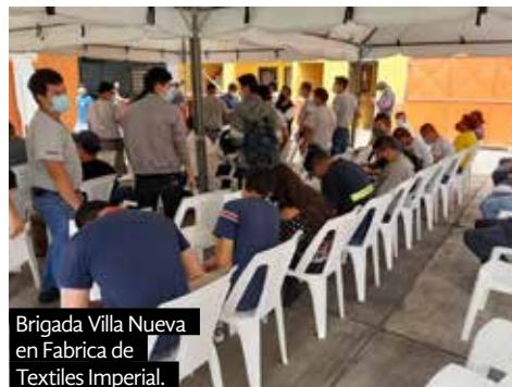
Brigada Villa Nueva en Fabrica de Textiles Imperial.