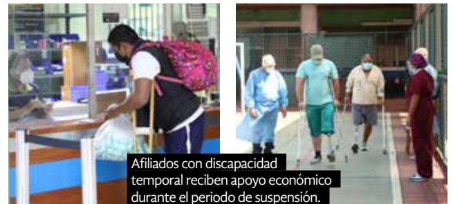
Afiliados con discapacidad temporal reciben apoyo económico durante el período de suspensión.