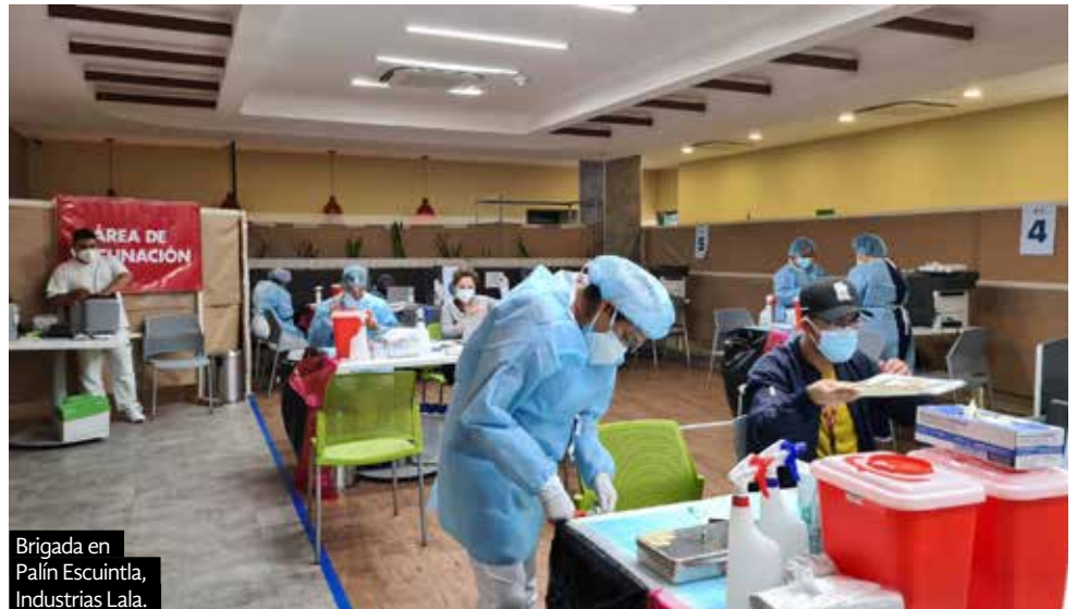
Brigada en Palín Escuintla, Industrias Lala.

Al 31 de agosto el IGSS ha administrado más de 500 mil entre primeras y segundas dosis lo cual merece una ovación a todo el personal de salud.