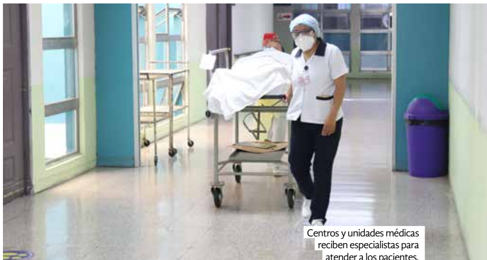
Centros y unidades médicas reciben especialistas para atender a los pacientes.