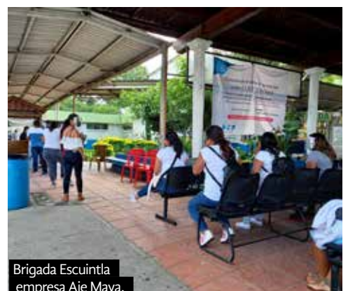
Brigada Escuintla empresa Aje Maya.