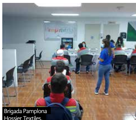
Brigada Pamplona Hossier Textiles.