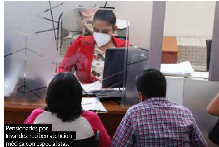
Pensionados por Invalidez reciben atención médica con especialistas.