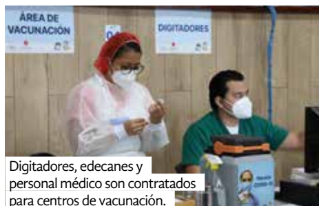
Digitadores, edecanes y personal médico son contratados para centros de vacunación.