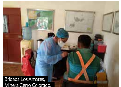
Brigada Los Amates, Minera Cerro Colorado.