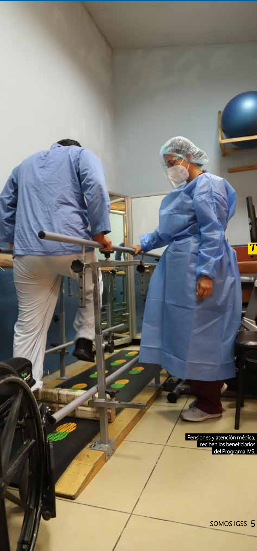
Pensiones y atención médica, reciben los beneficiarios del Programa IVS.