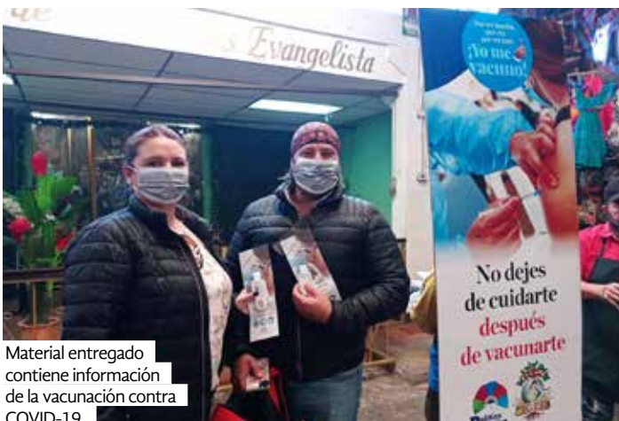
Material entregado contiene información de la vacunación contra COVID-19.