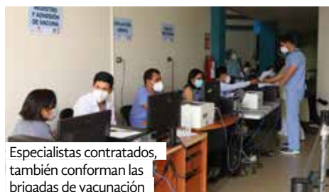
Especialistas contratados, también conforman las brigadas de vacunación

cumplimiento de los objetivos nacionales de vacunación contra el COVID-19, el IGSS al momento se está dotando de este personal contratado bajo el renglón 022, a los centros de vacunación habilitados en la ciudad capital, entre los que se puede mencionar los ubicados en: el campus central de la USAC en zona 12, Universidad Mariano Gálvez, Guardia de Honor, UVG Sololá y unidades de referencia del Instituto donde se está vacunando. El programa incluye la dotación del personal necesario a nivel nacional, en todos los centros de vacunación que se vayan habilitando en el futuro inmediato.