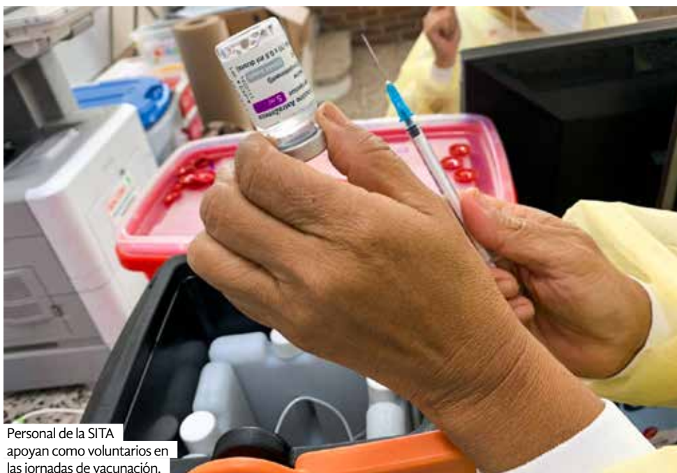
Personal de la SITA apoyan como voluntarios en las jornadas de vacunación.