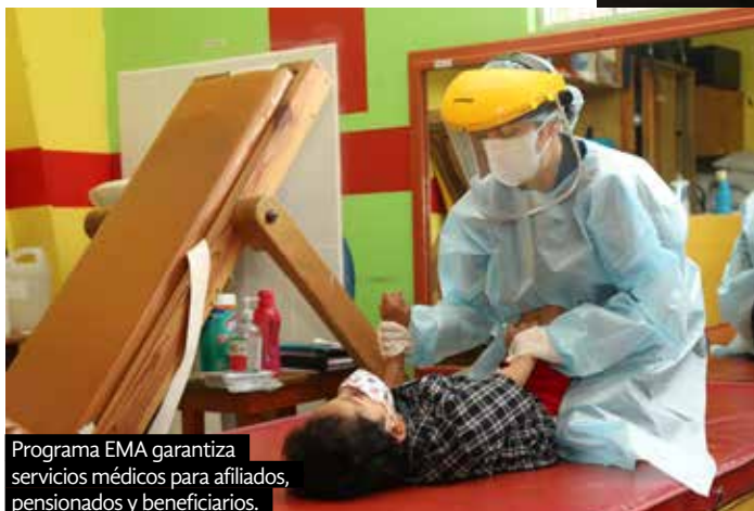
Programa EMA garantiza servicios médicos para afiliados, pensionados y beneficiarios.

Como parte de las funciones sustantivas de esta Subgerencia, se encuentran también, las pensiones que otorga el Plan de Pensiones de los Trabajadores al Servicio del