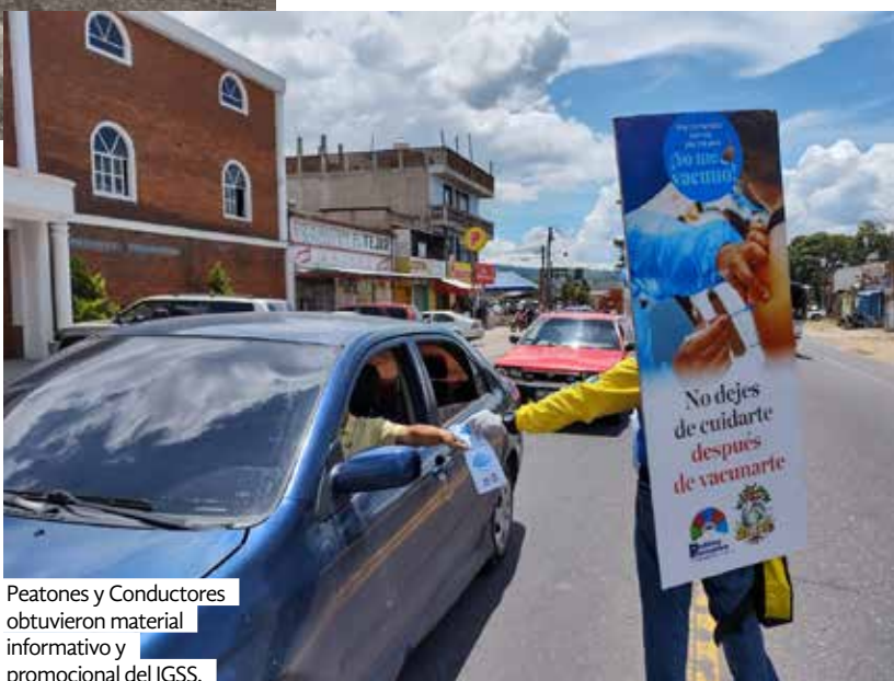
Peatones y Conductores obtuvieron material informativo y promocional del IGSS.

Durante estas actividades se hizo un llamado a la población para continuar con las medidas de prevención: lavado de manos, uso adecuado de mascarilla y distanciamiento físico. Además, cada persona obtuvo un frasco de bolsillo con alcohol en gel, material impreso informativo relacionado a la vacuna contra el COVID-19 y mascarillas quirúrgicas.