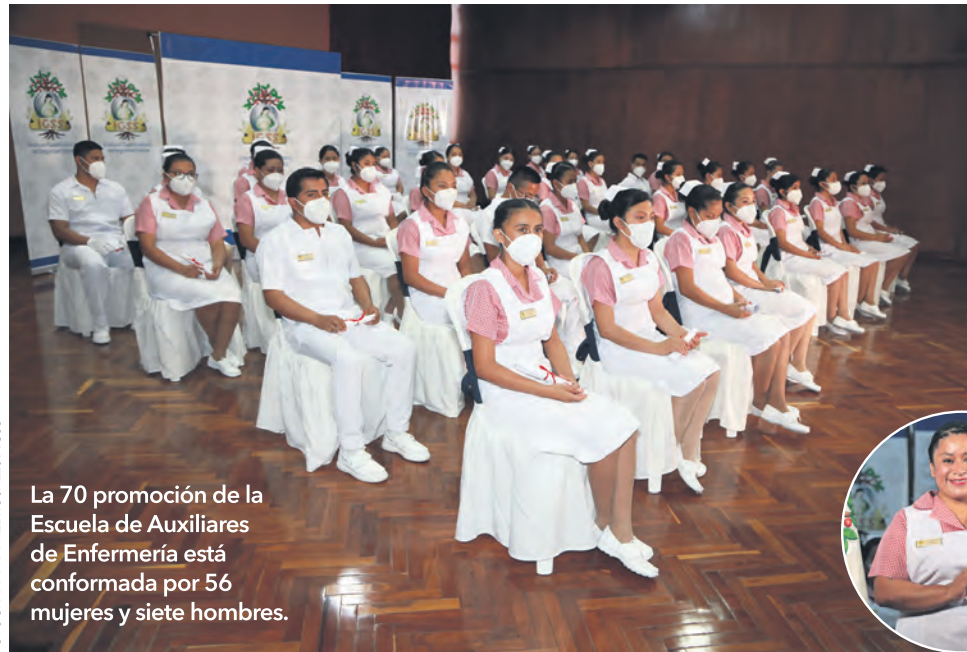
La 70 promoción de la Escuela de Auxiliares de Enfermería está conformada por 56 mujeres y siete hombres.