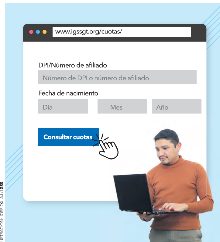
ILUSTRACIÓN: JOSÉ OXLAU / IGSS

Es importante que conozca que su denuncia puede ser anónima para su patrono, pero usted sí debe identificarse ante el Instituto para verificar la veracidad de lo denunciado.